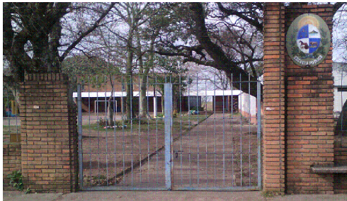
PORTON DE ACCESO